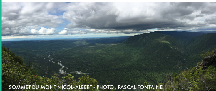
SOMMET DU MONT NICOL-ALBERT