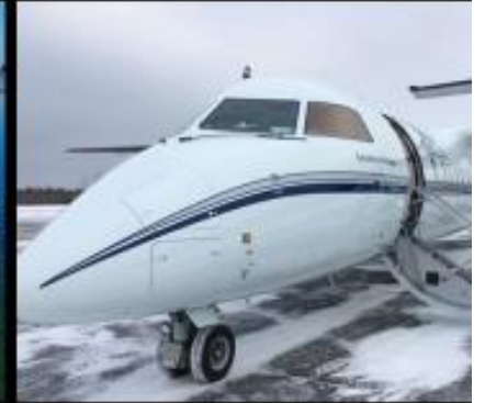
Nouvelle aérogare Petit-Matane