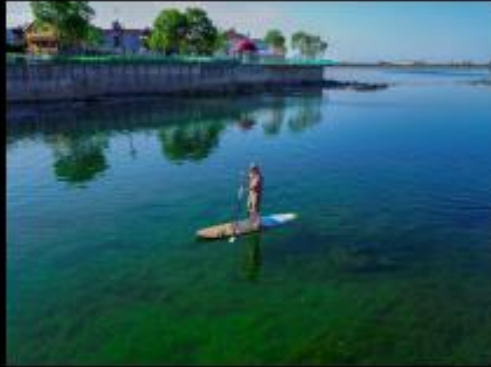
Expédition - Location de planche à pagaie