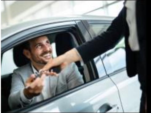
Location Pierre Villeneuve